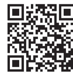
▲菊陽町並木公園ホームページ

公園の基本情報、施設案内、イベント情報、注意事項などはホームページ・Instagramからご覧いただけます。