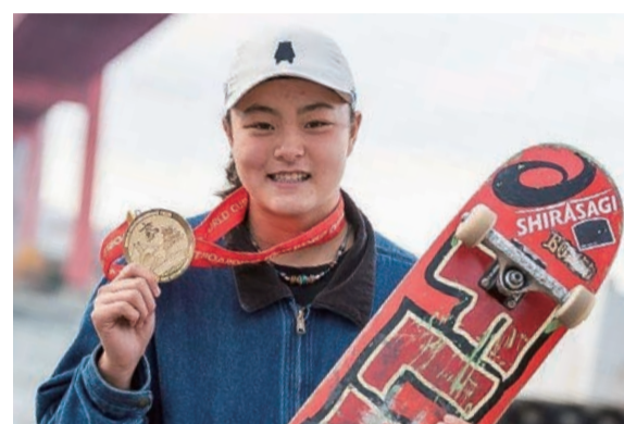
ワールドスケートボードストリート2025 北九州 女子優勝