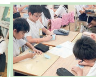
場所グループ 会場を楽しい雰囲気にする