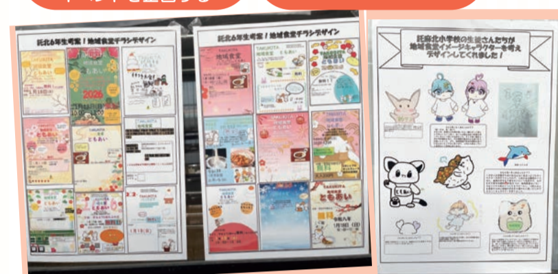
お知らせグループ チラシをつくる